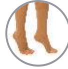
Açık Burun Open Toe