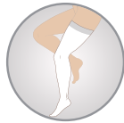
Diz Üstü Thigh High