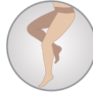
Belden Kemerli Thigh Length with Waist Belt