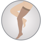
Diz Üstü Thigh High