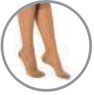
Kapalı Burun Closed Toe