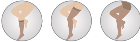
Diz Altı Knee High