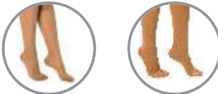
Kapalı Burun Closed Toe