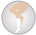
Diz Altı Knee High