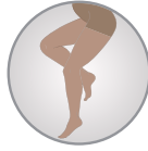
Hamile Külotlu Maternity