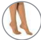
Kapalı Burun Closed Toe