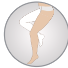
Belden Kemerli Thigh Length with Waist Belt