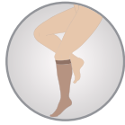
Diz Altı Knee High