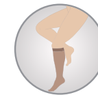
Diz Altı Knee High